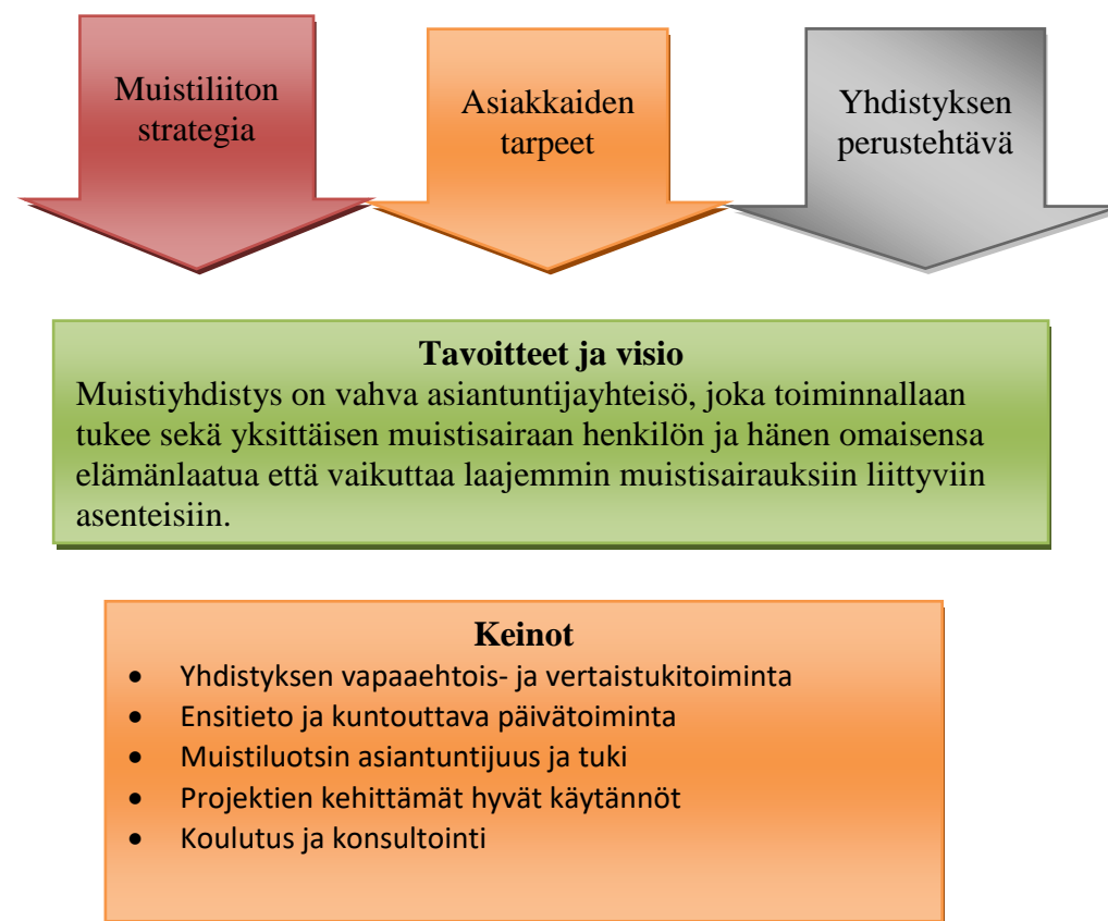
Kuvio: Varsinais-Suomen Muistiyhdistyksen toiminnan perusta

Muistiyhdistyksen toiminnan taustalla vaikuttavat yhdistyksen perustehtävä, muistiliiton strateginen linjaus ja ennen kaikkea toiminta-alueella asuvien asiakkaidemme tarpeet. Tavoitteenamme on olla vahva asiantuntijayhteisö. Toiminnassamme haluamme tarjota konkreettista tukea ja toimintaa yksittäiselle asiakkaalle, mutta myös vaikuttaa laajasti yhteiskunnallisessa keskustelussa.